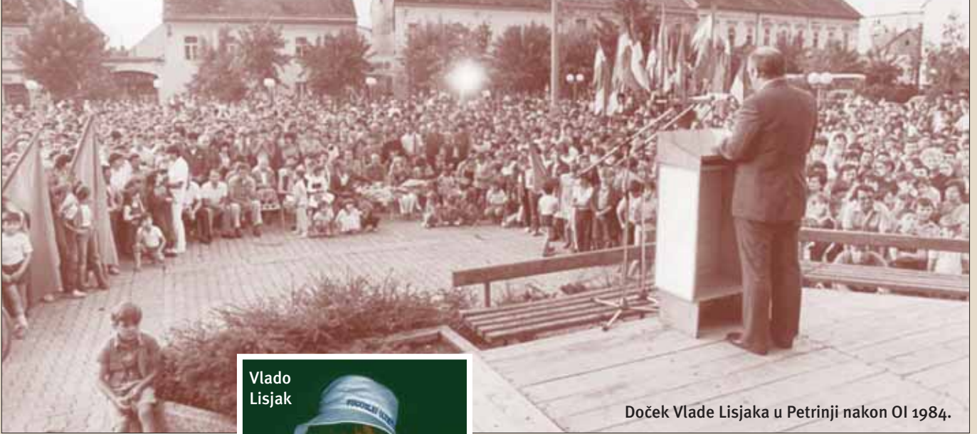
Doček Vlade Lisjaka u Petrinji nakon OI 1984.